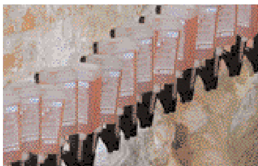
Die Injektion mit KÖSTER Crisin® 76 beginnt – die Wände „trinken“.

mit Druckluft gereinigt. Die Kapillarstäbchen werden in die Bohrlöcher geschoben und so abgemessen, dass sie ca. 5 cm aus der Bohrung heraus ragen. Anschließend werden Kartuschenwinkel auf die Kapillarstäbchen geschoben und durch leichtes Andrücken in der Bohrlochmündung verkeilt. Nachdem die Stäbchen gewässert wurden, um durch Quellung das gesamte Bohrloch auszufüllen, werden die Kartuschen in die Kartuschenwinkel eingesetzt und verbleiben dort bis zur vollständigen Entleerung des Injektionsstoffes.