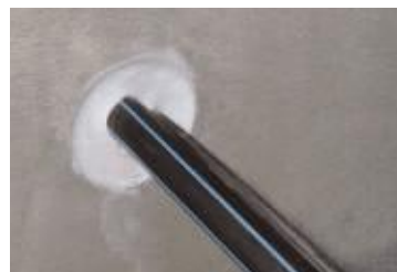
... und dauerhaft sicher gestoppt.