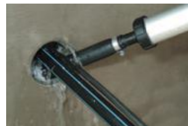
... Kabeldurchführung wird mit ...