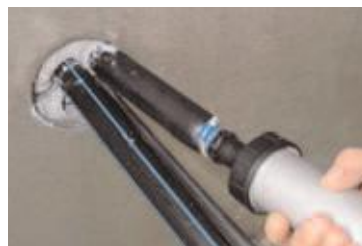
... sofort, unkompliziert ...