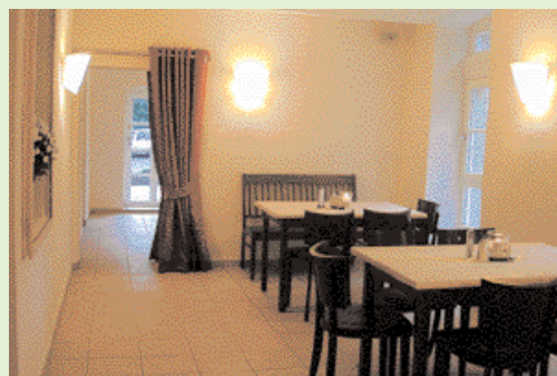
Garantiert dicht: Die neue Nutzung des Sattelmeierhofes nach der gesamten Renovierung.