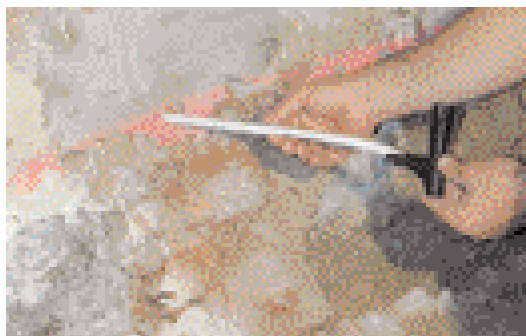
Die saugfähigen Kapillarstäbchen werden in die Bohrlöcher geschoben und die Kartuschenwinkel aufgesetzt.