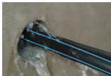
Wassereintritt an einer ...

Ein besonderer Vorteil der Paste auf Polyolefin-Basis ist auch, dass sie nicht austrocknet, sondern dauerhaft formbar bleibt. Diese Plastizität garantiert eine beständige Abdichtung und eröffnet die Möglichkeit, auch später noch Leitungen durch die bestehende Abdichtungsmasse hindurch zu führen, ohne dass Stemmarbeiten oder Neuabdichtungen erforderlich sind.