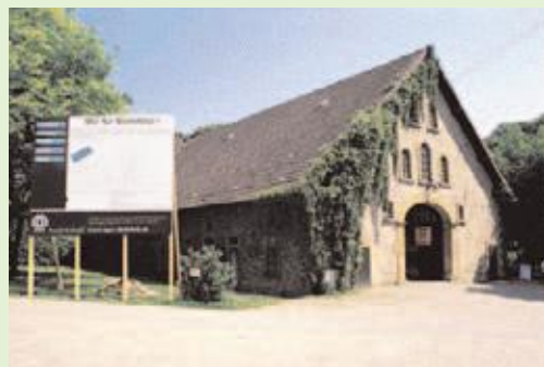
Das Objekt: Im Sattelmeierhof wurden bis Mitte der Fünfziger Jahre Pferde, Rinder und Schweine gehalten.