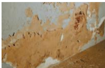
Innen deutlich sichtbar: Feuchte und Schimmelbildung an nahezu allen Wänden.

aussen, an den 60 cm dicken Bruchsteinmauern, waren ungleichmäßige Salzausblühungen bis zu einer Höhe von 1,5 m sichtbar. Besonders dort, wo Rinder- und Schweineställe von innen sowie Dunghaufen von außen ehemals für