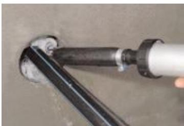
... KÖSTER KB-Flex 200 Dichtpaste ...